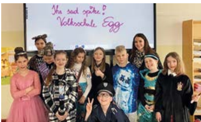
Große Freude bei allen SchülerInnen über die neuen digitalen Schultafeln.