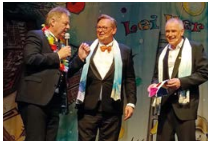
Zwei Präsidenten nehmen Abschied von ihrer Funktion.

Im letzten Jahr habe ich gemeinsam mit allen Stadträten zu mehreren Bürgerversammlungen eingeladen, welche durchaus sehr gut besucht waren: Rattendorf, Presseggen und Egg. Im Mittelpunkt