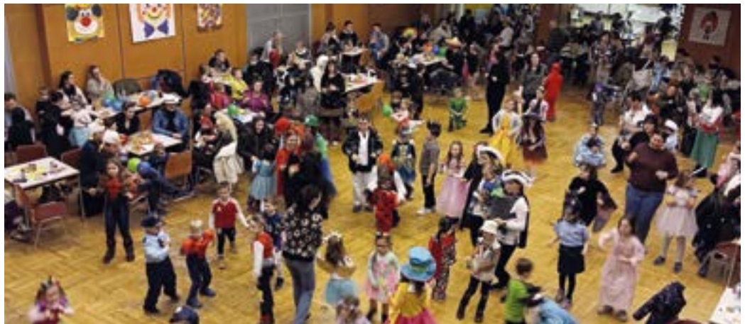
Alljährlicher Kinderfasching in Hermagor.