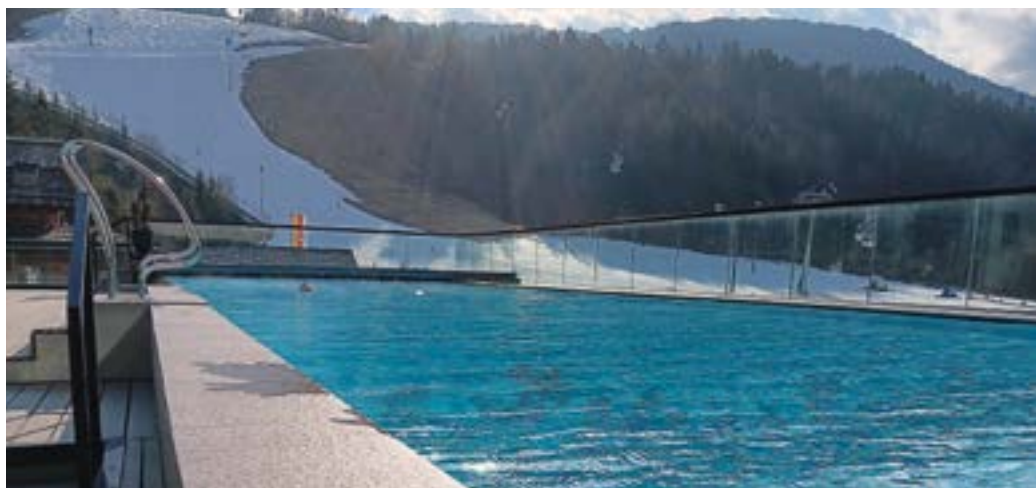
Laufende Erweiterungen und Qualitätsverbesserungen bei unseren heimischen Tourismusbetrieben sind der Schlüssel zum Erfolg (Beispiel Hotel Franz Ferdinand mit neuem Wellnessbereich).

Jedenfalls sollen die Unterstützungen des gesellschaftlichen Lebens, welches sehr stark durch unsere aktiven Vereine und Organisationen repräsentiert wird, im bisherigen Umfang erhalten bleiben. Voraussetzung ist aber immer wieder, dass die Wirtschaftskraft unserer Unternehmen so hoch bleibt und die gemeindeeigenen Einnahmen auch den Prognosen entsprechen.