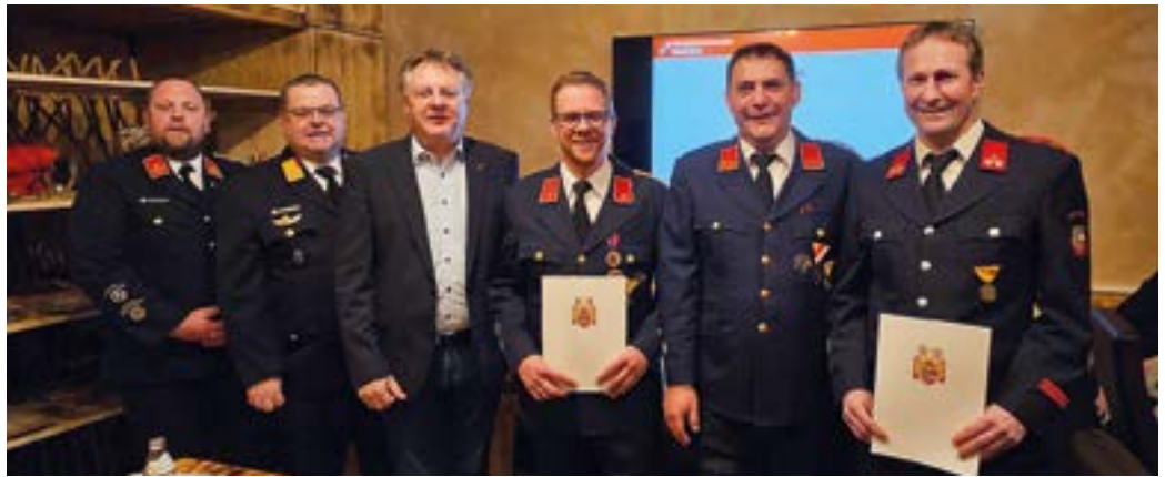
Ehrungen bei der diesjährigen JHV der FF Rattendorf.

Nach vier Jahren gab es aufgrund der coronabedingten Unterbrechung wieder Faschingsitzungen unserer Hermagorer Faschingsgilde. Sechs ausverkaufte Sitzungen brachten ein übereinstimmendes Echo: Große Begeiste-