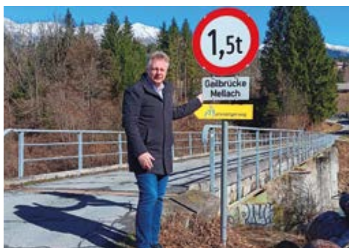
Die Mellacher Gailbrücke ist zu sanieren.

Im Herbst letzten Jahres fand eine Hauptprüfungskontrolle unserer Gailbrücken statt. Das Ergebnis für die Mellacher Gailbrücke war ernüchternd: Der Statiker stellte fest, dass die Tragfähigkeit nur mehr für eine Last von 1,5 t gesichert werden kann. Insbesondere die Fahrbahnplatte, aber auch die Pfeilerköpfe, sind zu sanieren. Auch der Korrosionsschutz der Stahlträger ist zu erneuern. Die Gemeinde musste daher die