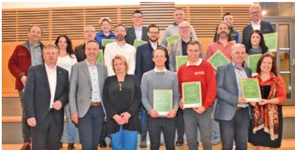
Attraktive Arbeitgeber der Region Nassfeld – Pressegger See/Lesachtal/Weissensee anlässlich der Auszeichnung