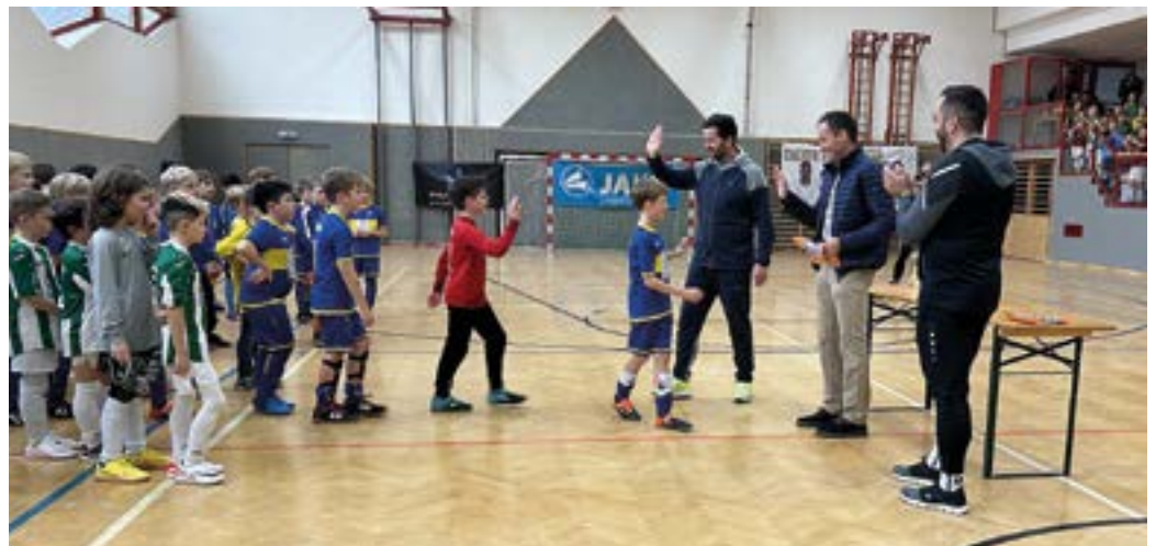
U9 Turnier, Preisverleihung

Herausgeber und für den Inhalt verantwortlich: Stadtgemeinde Hermagor-Pressegger See, 9620 Hermagor, Wulfeniaplatz 1, Tel. 04282-2333 · Für den Inseratenteil verantwortlich und Druck: Seebacher GmbH, 9620 Hermagor, Tel. 04282-2171. Titelbild Fotos: Christian Wasserthurer, Rudi Schneeberger, Gert Perauer · Erscheint 6x jährlich.