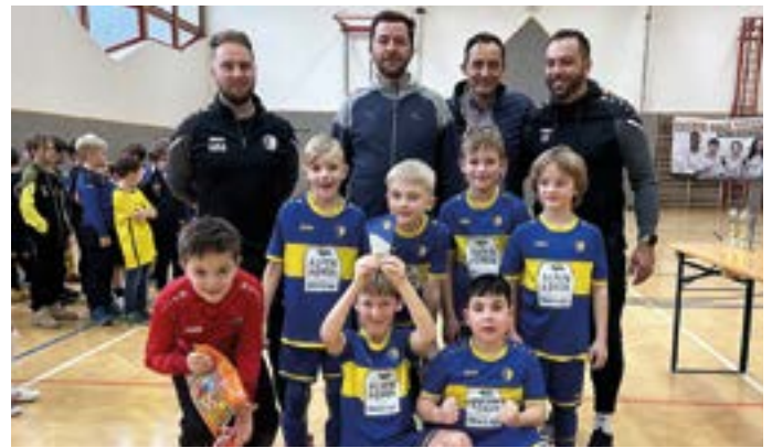
U9 Mannschaft FC Hermagor mit Trainern