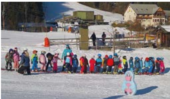
Der Kindergarten Hermagor veranstaltete Mitte Jänner einen Skikurs in Weißbriach. 65 begeisterte Pistenflitzer hatten viel Spaß in der Schnee. Mit Unterstützung der Skischule Flaschberger wurden diese Tage ein voller Erfolg. Mit einem Rennen endete die unfallfreie Skiwoche.